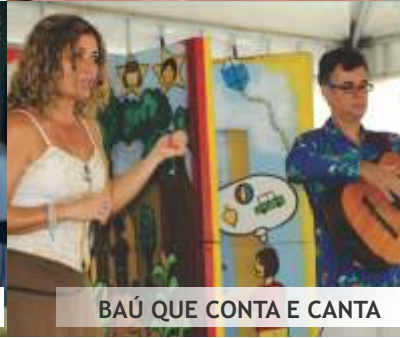
BAÚ QUE CONTA E CANTA